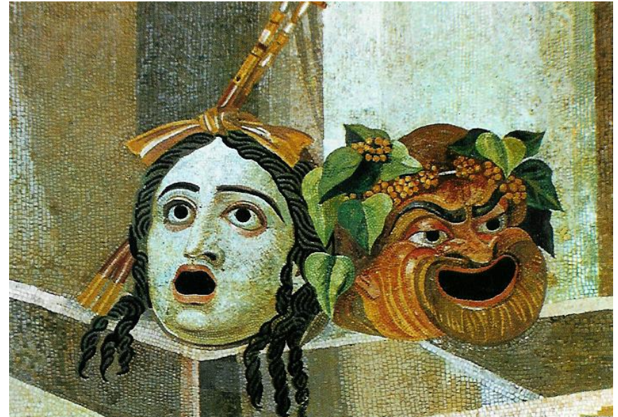
Römische Theatermasken (Musei Capitolini, Mosaik, um 100 v. Chr.)